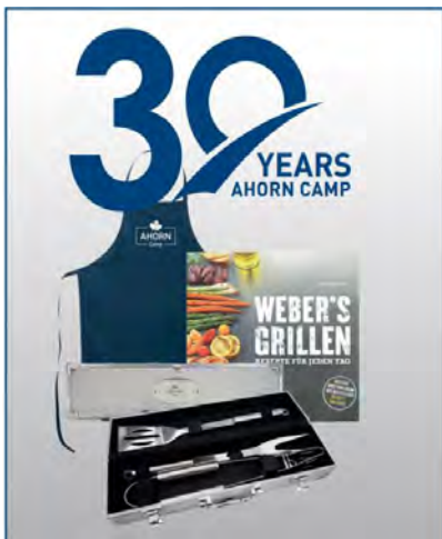
Ahorn Camp 30-Years Grillset

Die exklusive Ausstattung: Renault Chassis Paket • Design Paket • Fahrerhaus in Silber • Sonderbeklebung • Rückfahrkamera • Fahrerhausklimaanlage • Markise • Assistenzpaket • Fliegengittertüre • LED Außenleuchte • LED Beleuchtung • Rahmenfenster • Navi & Radio System • Alufelgen • Exklusives Polsterdesign