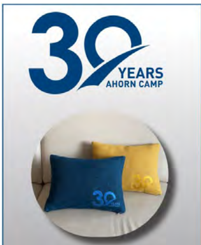
Ahorn Camp 30-Years Kissen