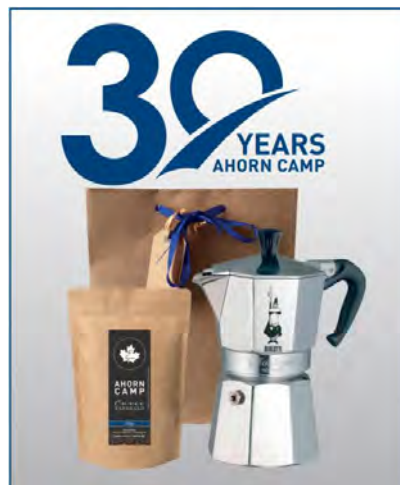
Ahorn Camp 30-Years Kaffeeseit