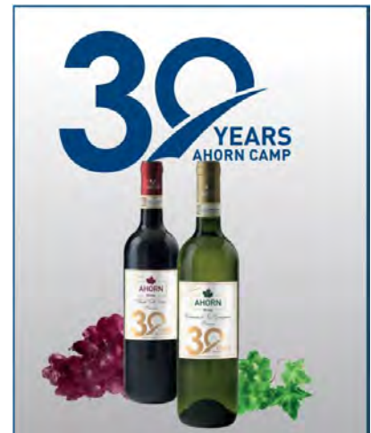
Ahorn Camp 30-Years Wein