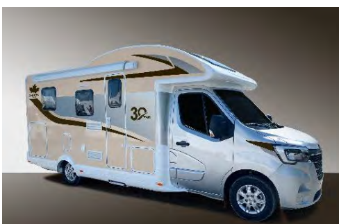
30-Years-Edition der Canada Serie